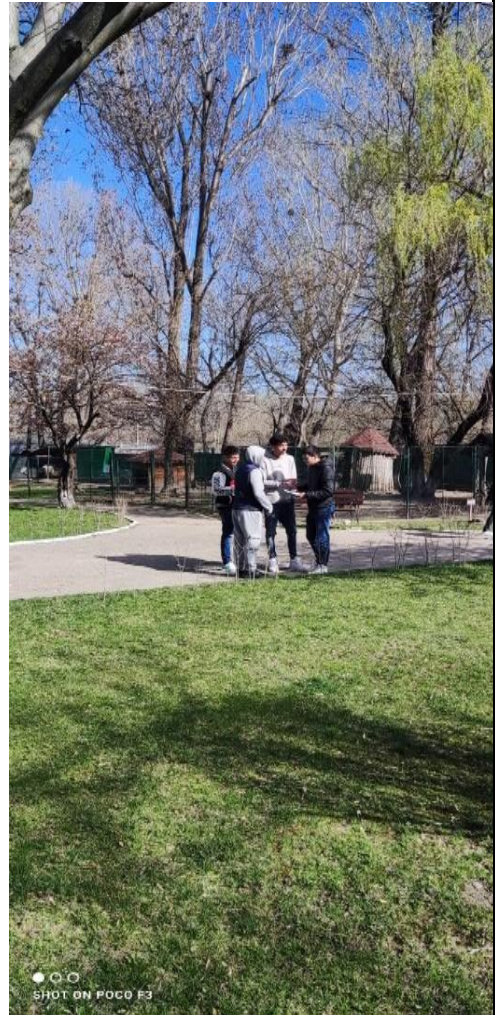
Campanie în parcul Chindia