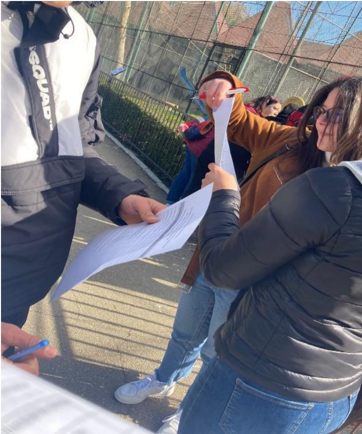
Campanie în cadrul liceului I.H. Rădulescu