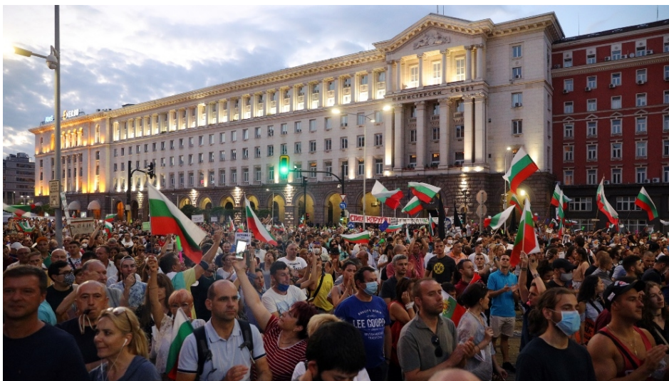
Protestele anti-corupție din vara anului 2020 au determinat zeci de mii de bulgari să iasă în stradă.

Lupta împotriva corupției a fost laitmotivul anului 2020 care a culminat cu cele mai extinse proteste împotriva guvernului din ultima decadă. O serie de evenimente de la începutul verii, care arătau corupția principalilor actori politici, au determinat zeci de mii de bulgari din Sofia și alte mari orașe din Bulgaria să iasă în stradă și să protesteze pentru mai mult de trei luni împotriva guvernului lui Boyko Borisov. CRPE a detaliat pe larg evenimentele în cadrul raportului Cu masca în stradă: Bulgaria protestează de peste 100 de zile împotriva corupției . Printre revendicările protestatarilor se număra și demisia guvernului (care nu a fost votată în Parlamentul majoritar favorabil GERB) și a procurorului Ivan Geshev.